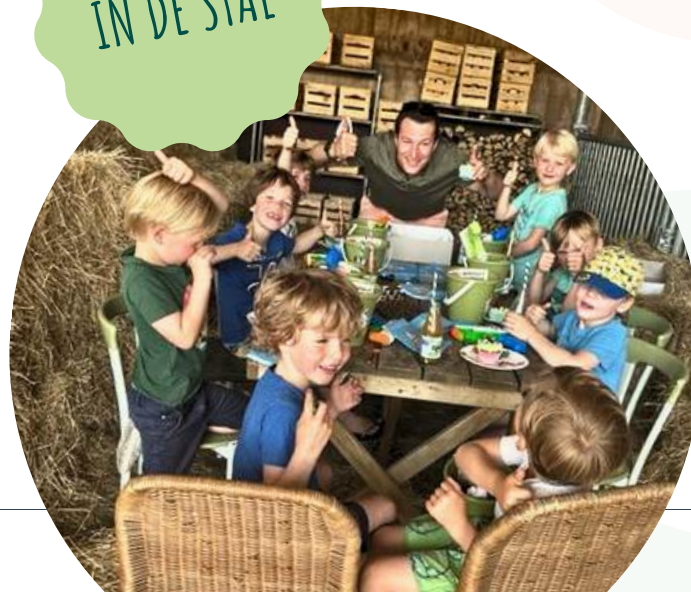
IN DE STAL

De speurtocht is een ideaal voor een partijtje of kinderverjaardag. Het feestje compleet maken? Begin of eindig in onze open stal, wij zetten de kannen limo vast klaar. Losse drankjes en ijsjes haal je in het restaurant. Je reserveert de speurtocht op de pagina OERRR speelnatuur op onze website