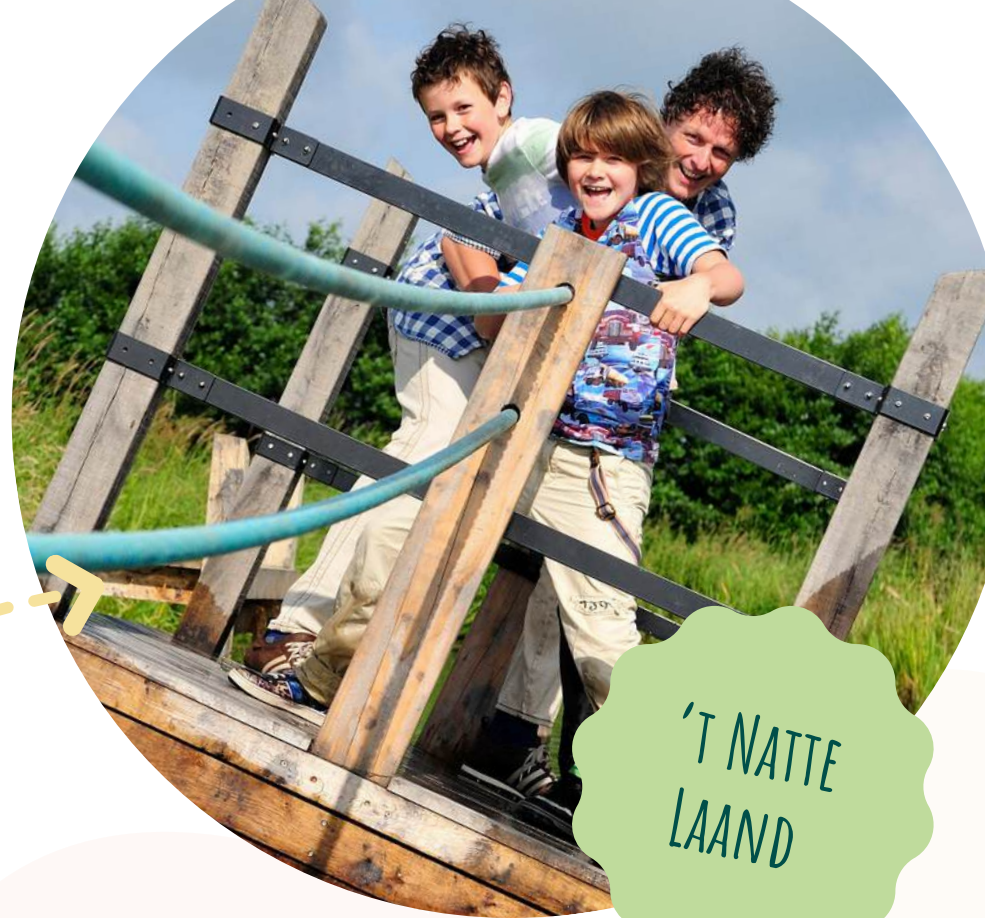
'T NATTE LAAND

Hoeve Wielrevelt is een plek om even uit de drukte te stappen. De omgeving nodigt uit tot rondstruinen. Kinderen spelen in de OERRR natuurspeeltuin of kijken bij de dieren op het erf. Samen met Natuurmonumenten hebben we een avontuurlijke speurtocht ontwikkeld: een spannende expeditie leuk voor de kleine avonturier van 4 t/m 10 jaar.