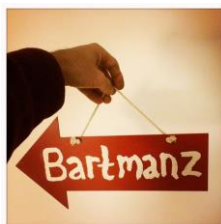
Bij het hek