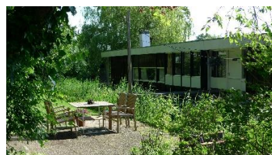
Entree tuin Bartmanzboot