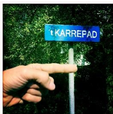
Bij 't Karrepad