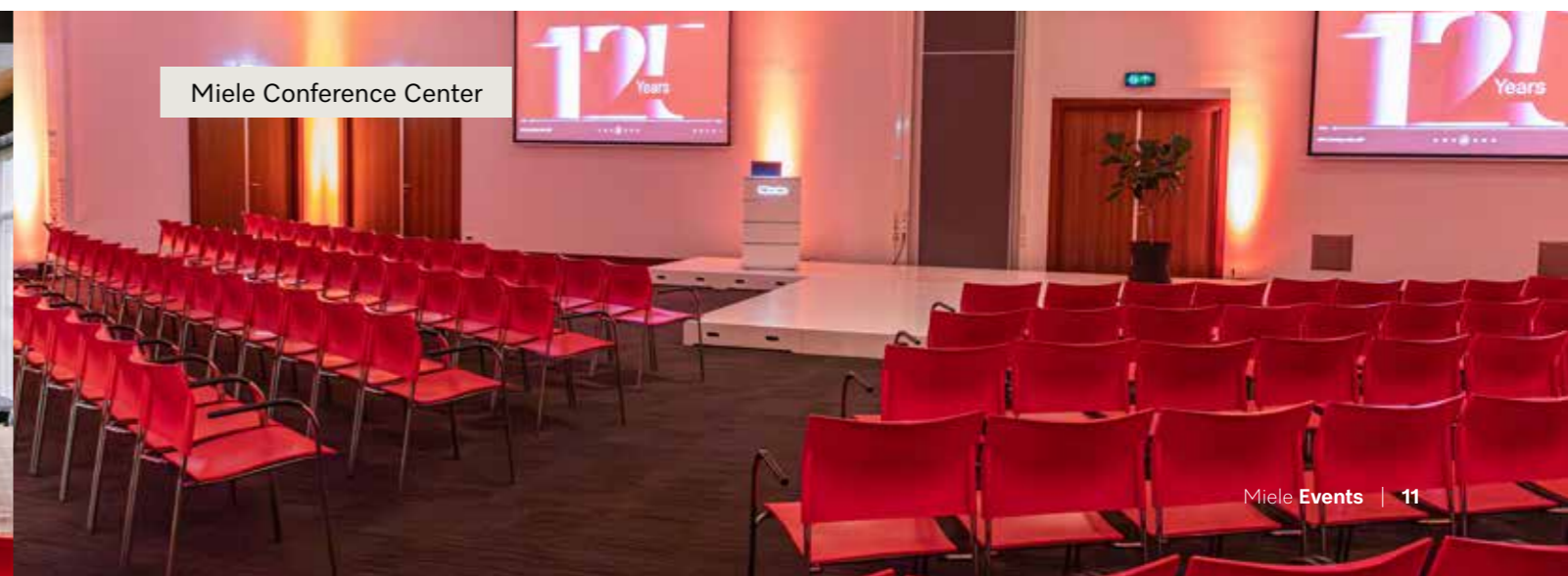
Miele Conference Center