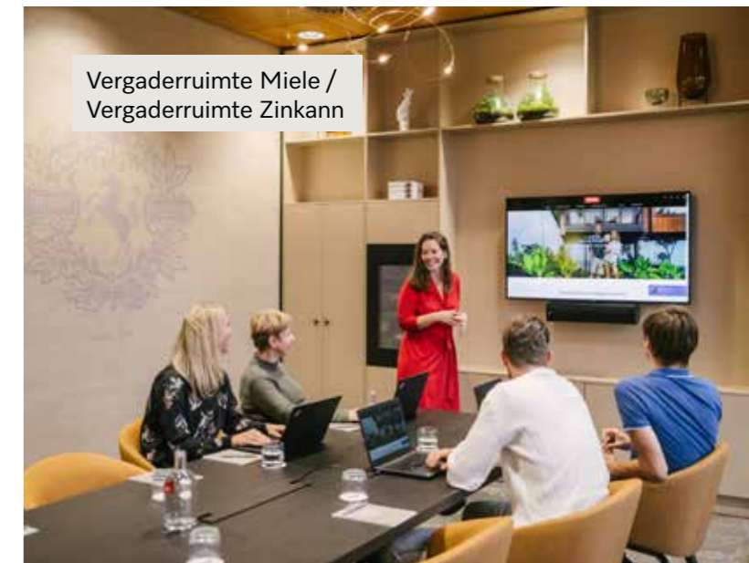
Vergaderruimte Miele / Vergaderruimte Zinkann