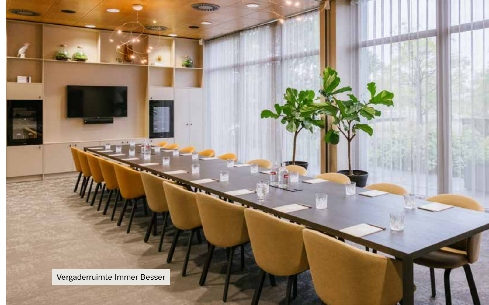
Vergaderruimte Immer Besser

Een vergadering of training buiten de deur zorgt voor een andere dynamiek. Bij Miele Events beschikken we over verschillende ruimtes met daglicht in overvloed, comfort als basis en allemaal voorzien van de laatste technische snufjes.